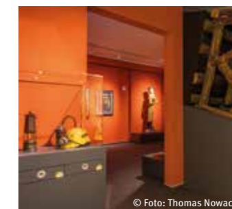
Blick in die Bergbauabteilung

Das stadthistorische Museum RETRO STATION bietet die Möglichkeit, die spannende Geschichte Recklinghausens zu entdecken und sich auf eine Zeitreise zu begeben. Im modern gestalteten Ausstellungsbereich werden zahlreiche Ausstellungsstücke präsentiert, die für die Entwicklung Recklinghausens von Bedeutung sind.