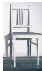
Gerhard Richter: Küchenstuhl, 1965