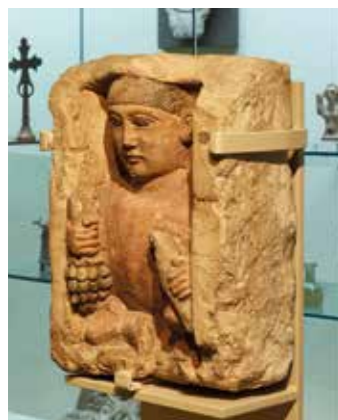
Nischenfigur eines hockenden Knaben, Ägypten, Ende 3. Jahrhundert

Das Ikonen-Museum Recklinghausen lädt Sie ein zu einer Reise in die Bilderwelt der ostkirchlichen Kunst. Es beherbergt über 4.000 Ikonen, Stickereien, Miniaturen, Holz- und Metallarbeiten aus Russland, Griechenland und verschiedenen Balkanstaaten. Zu den Exponaten gehören international renommierte Spitzenwerke ebenso wie Objekte des Alltags. Recklinghausen besitzt damit das bedeutendste Museum ostkirchlicher Kunst außerhalb der orthodoxen Welt. Es macht die Vielfalt und Entwicklung dieser Kunst erlebbar, die auch für die