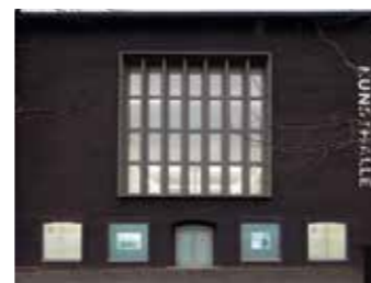
Videokunstnächte, Foto: Alistair Overbruck

Per Kirkeby. Weitere Schwerpunkte sind das deutsche Informel und kinetische Kunst.