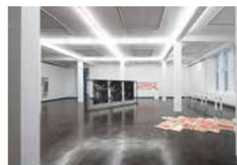
Ausstellungsansicht Kunstpreis junger westen 2021, Foto: Alistair Overbruck