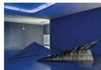
Ausstellungsansicht Flo Kasearu