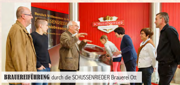
BRAUEREIFÜHRUNG durch die SCHUSSENRIEDER Brauerei Ott

Kombinieren Sie Ihren Besuch bei uns mit unseren Führungen , einer Bierprobe oder der Gaudi beim Bierkrugrutschen .