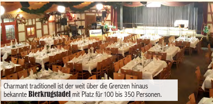
Charmant traditionell ist der weit über die Grenzen hinaus bekannte Bierkrugstadel mit Platz für 100 bis 350 Personen.