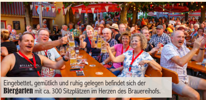
Eingebettet, gemütlich und ruhig gelegen befindet sich der Biergarten mit ca. 300 Sitzplätzen im Herzen des Brauereihofs.