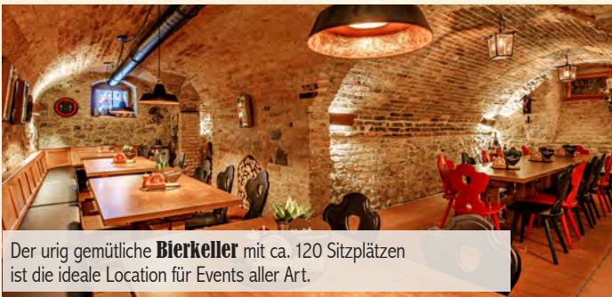
Der urig gemütliche Bierkeller mit ca. 120 Sitzplätzen ist die ideale Location für Events aller Art.