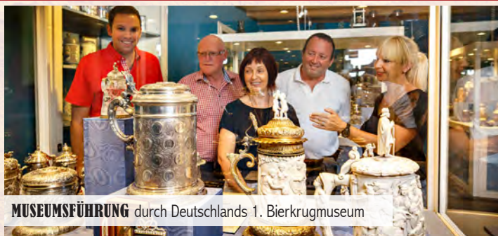
MUSEUMSFÜHRUNG durch Deutschlands 1. Bierkrugmuseum